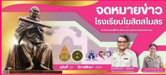
ถ่ายทอดธรรม จริยธรรม นักเรียนระดับชั้นประถมศึกษาปีที่ 5-6 ปีการศึกษา 2567